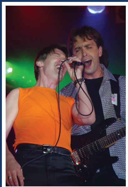
Prestation à la Fête Nationale de Granby Juin 2003

Fort de l'expérience du premier album et toujours avides de partager la passion qui les anime, ils entament l'écriture du second dès 2004 et poussent encore plus loin la subtilité et la richesse de leurs compositions musicales. Nul doute que le groupe est fin prêt pour faire le grand saut et inscrire plusieurs de leurs chansons dans les palmarès pour de nombreuses années à venir.